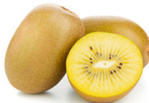
Kiwi jaune ( Actinidia chinensis ), variété plus précoce que le vert, le fruit est plus doux et sucré, sa peau est lisse