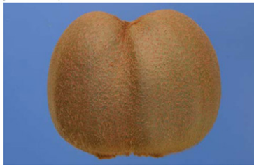
photo 27 : Caractéristique minimale "bien formés" - Fruit double - exclu

photo 27: Minimum requirement "well formed" - Double fruit - not allowed