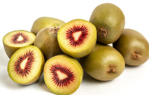
Kiwi jaune à coeur rouge ( Actinidia tomuri )