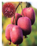
Kiwi de Sibérie, Actinidia arguta purpurea