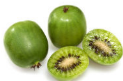
« Actinidia arguta » appelé aussi « kiwai » ou encore « baby kiwi », peau lisse comestible, le fruit se consomme entier et non pelé