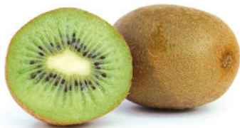
Kiwi vert ( Actinidia deliciosa ), la variété la plus répandue est la variété Hayward

Actinidia chinensis > fruits à peau lisse